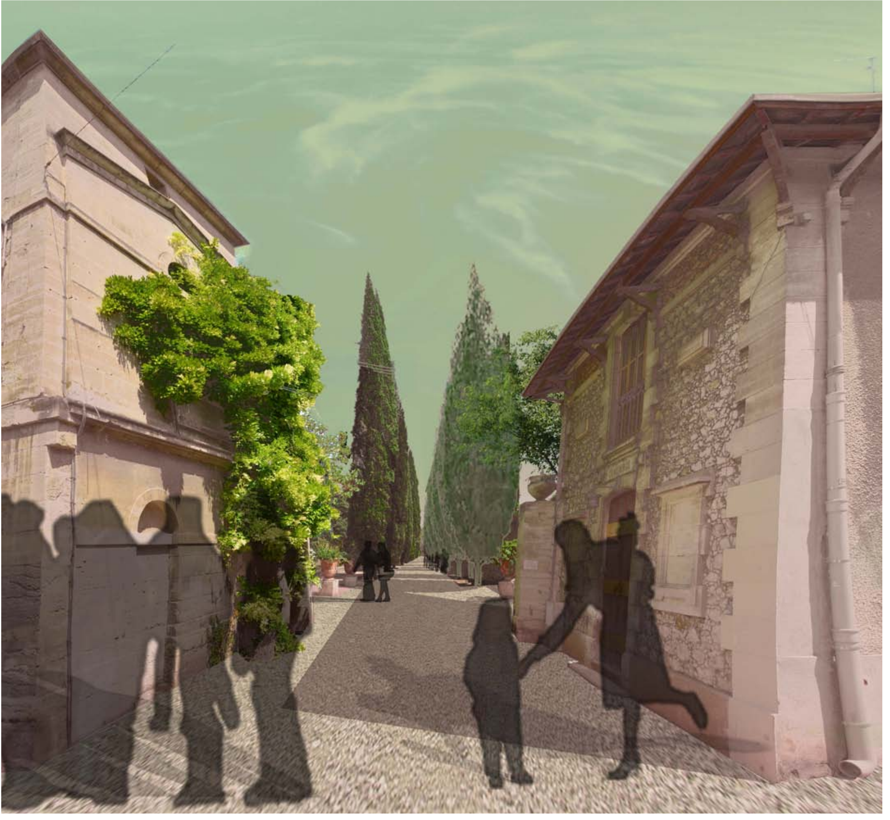
Pierre Richer de Belleval, le créateur du Jardin des plantes, règne sur l'entrée historique du Jar-